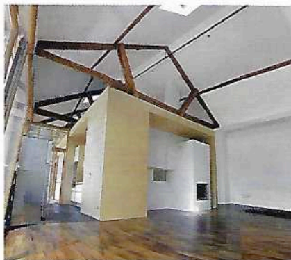
Zwei von Architekt Hans Zeiner umgebaute Vierkanthöfe: Im Bild oben wurde ein alter Getreidespeicher („Troadkasten“) zum Wohngebäude umgestaltet. Die unteren beiden Bilder zeigen das Projekt „Heu“, eine Loftwohnung in einem ehemaligen Heuboden mit frei eingestellter Schlafzimmerbox.

teile um einen gemeinsamen Hofraum angeordnet, aber noch nicht verbunden waren. Beim Vierkanter schließlich sind diese typischen Gehöftteile miteinander verkantet und bilden ein Rechteck oder Quadrat mit mittigem Hof.